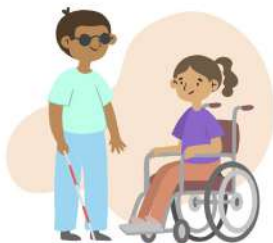
Personas con discapacidad.