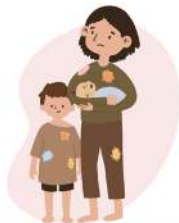
Personas en situación de pobreza extrema.