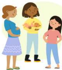
Mujeres en edad fértil: adolescentes, embarazadas y lactantes.