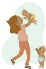
0 a 2 años (los primeros 1,000 días de vida).