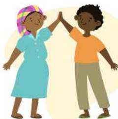
Indígenas y afrohondureños.