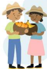
Campesinos y campesinas que producen para el autoconsumo.